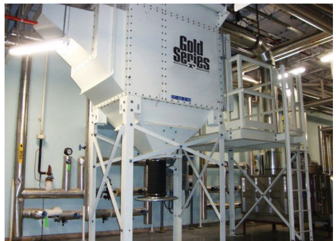
Beispiel für die Installation einer typischen Absauganlage.

Rohrleitung oder Rohrleitungssystem – Das Rohrleitungssystem transportiert den Staub zur Absauganlage, wo er abgeschieden wird. Die Auswahl des richtigen Durchmessers an jeder Verzweigung des Rohrleitungssystems erfordert eine:n erfahrene:n und qualifizierte:n Techniker:in. Er/sie berechnet die Strömungsgeschwindigkeit, die erforderlich ist, um den