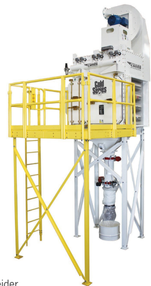
Gold Series Camtain Trockenabscheider für pharmazeutische und gefährliche Stäube

Analyse der Partikelgröße - je höher die Partikelkonzentration im ultrafeinen Bereich, desto größer ist in der Regel das Explosionspotenzial und die Gefahr für die menschliche Gesundheit, die Umwelt und die Produktion. Diese Information hilft bei der Auswahl des richtigen Absaugsystems, das für eine effektive Staubabscheidung erforderlich ist. Es gibt Firmen, die Partikelanalysen anbieten. Einige davon verfügen sogar über eigene Labors und Analyseeinrichtungen.