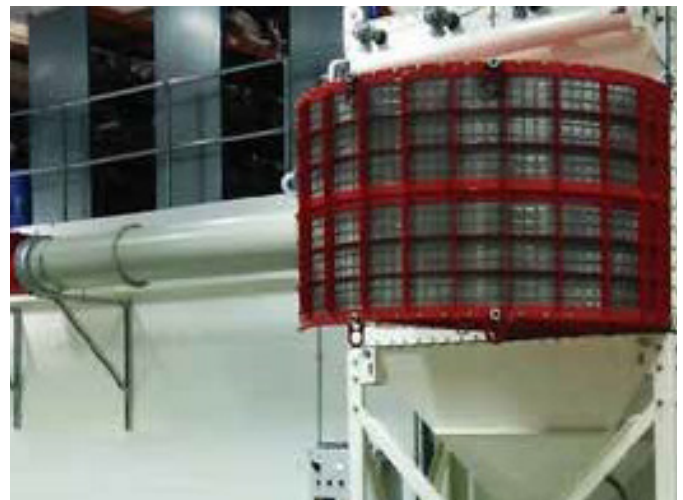
Die flammenlose Druckentlastung ist für den Einbau über einer konventionellen Entlüftung vorgesehen und löscht die aus dem entlüfteten Bereich austretende Flammenfront, so dass diese nicht aus dem System entweichen kann. Auf diese Weise kann eine konventionelle Entlüftung in Innenräumen installiert werden, wo sie sonst das Personal gefährden könnte. Eine Entlüftung in einen anderen sicheren Bereich ist nicht möglich (Gefahr der Sekundärentzündung).