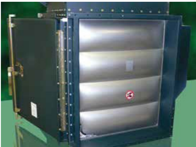
Berstscheiben sind als „Schwachstelle“ des Behälters konzipiert und öffnen sich bei Erreichen eines bestimmten Innendrucks, so dass der Überdruck und die Flammenfront in einen sicheren Bereich entweichen können. Explosionsdruckentlastungseinrichtungen minimieren Schäden am Absaugsystem, die durch den bei einer Verpuffung entstehenden Überdruck entstehen.

Flammenlose Druckentlastungseinrichtungen – Für diese Einrichtungen gelten die gleichen Auslegungskriterien wie für Berstscheiben. Sie leiten den Explosionsdruck sicher ab und haben den zusätzlichen Vorteil, die Flammenausbreitung zu stoppen, können aber nicht in einen sicheren Bereich entlüften und erfordern eine definierte Sicherheitszone um das System herum. Sie sind in der Regel für die Installation in Innenräumen vorgesehen. Es gibt Einschränkungen bei der Auswahl, die vom Lieferanten des Absaugsystems auferlegt werden können. Auch bei dieser Lösung wird Staub freigesetzt, in diesem Fall in einem begrenzten Bereich.