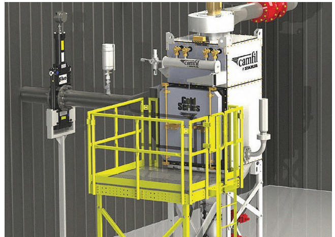
Beispiel eines Absaugsystems mit verschiedenen Sicherheitssystemen, die je nach den besonderen Eigenschaften des Staubes und des Gases in einer Anwendung, spezifiziert sind.

Ein weiterer wichtiger Aspekt, der oft übersehen wird, ist die wirksame Eindämmung gefährlicher Stäube. Sobald Staub an der Quelle erfasst wird, muss er in jeder Phase des Prozesses kontrolliert werden. Dies ist ein wichtiger Aspekt, um eine Kreuzkontamination von Produkten zu verhindern und trägt dazu bei, die Anforderungen von Behörden wie der European Medicines Agency (EMA), der Medicines and Healthcare Regulatory Agency (MHRA) und anderen zu erfüllen, wenn Produktionsprozesse nach GMP (Good Manufacturing Practice - euGMP) auditiert werden. Die Abdichtung der Kanalanschlüsse des Absaugsystems und aller Zusatzeinrichtungen, wie z. B. Schutzsysteme, ist zwingend erforderlich.